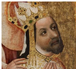
Karel IV. (1316 - 1378), český král a císař Svaté říše římské. Votivní panel Jana Očka z Vlašimi.

Král Karel IV. pak v návrhu zemského zákoníku Maiestas Carolina (Codex Carolinus) stanovuje Křivoklát jako nezcizitelné zboží. Přestože majetek byl v dalších staletích několikrát dán do zástavy různým šlechticům, vždy se vrátil do panovnickových rukou a zůstával v majetku Koruny české.