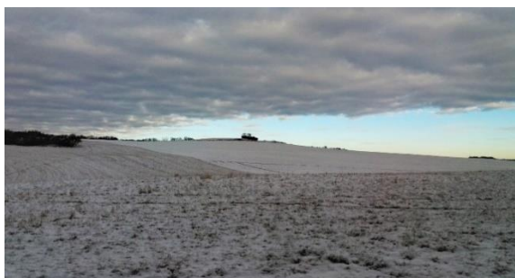
Na nejvyšších místech hradišť byla situována tzv. akropole, kde se nacházela svatyně či sakrální místa (mohlo však jít i o sídla nejmocnějších příslušníků kmene).

Dějiny skryté hluboko v tmavé půdě začaly na světlo světa vydávat svá svědectví a památky - kopáči našli další a další stříbrné a zlaté keltské mince (nalezené rovněž na Křivoklátě, u Zbečna, Branova, Týřovic, Hřebečnicků, v Podmoklech a ve Zbizoze), které v dodnes zachovaném počtu představují jednu z největších kolekcí keltských mincí ve střední Evropě. Našli se tu ale i mince antické, dále jemná keramika (původem i z velmi vzdálených částí Evropy a severní Afriky), nejrůznější železné předměty a nářadí (části jezdecké výstroje, kusy podkov, klíče, kleště, nůžky, chirurgické nástroje, spony z drahých kovů, bronzu nebo železa), korále a skleněné náramky (sklo jako surovina se dováželo ze Středomoří).