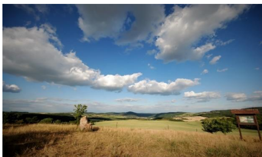
Pohled na hlavní plochu někdejšího keltského hradiště.

Poblíž obce Stradonice, vysoko nad okolním světem, na plošině táhlé ostrožny obtékané z jedné strany řekou Berounkou v hlubokém korytu a z druhé Habrovým potokem, si mezi lety 150 a 125 př.n.l. postavili opevněné hradiště neboli oppidum (podle římského označení byla oppida společenskými, politickými a hospodářskými centry, tedy jakýmsi předchůdci měst).