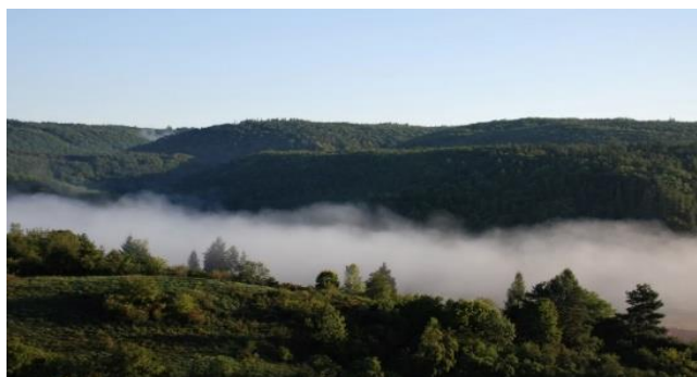
Ranní mlhy válející se v údolí Berounky, Křivoklátsko.

Pestrou přírodu na sever od francouzských Alp, dramatické soutěsky i rozlehlé louky posázené oky modrých jezer obývali již od mladší doby bronzové lidé zvláštního národa. V 8. až 5. století před naším letopočtem se odtud začali šířit dále po Evropě a do povědomí ostatních vstoupili nejen jako zruční řemeslníci a obchodníci, ale i jako obávaní válečníci. Byli ztělesněním řemeslného, technického a společenského pokroku, pro mnohé se proto stávali symbolem vyspělé civilizace.